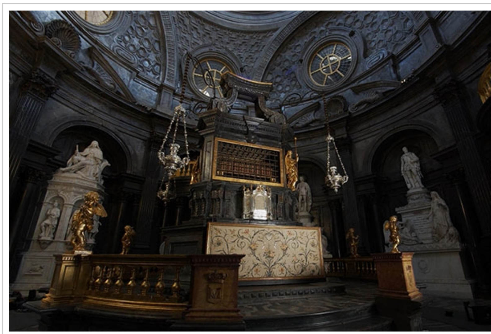
Altare Cappella della Sindone

Dopo la riapertura al pubblico della Cappella, festeggiata il 27 settembre 2018, la restituzione del monumento alla comunità viene oggi completata con l'altare