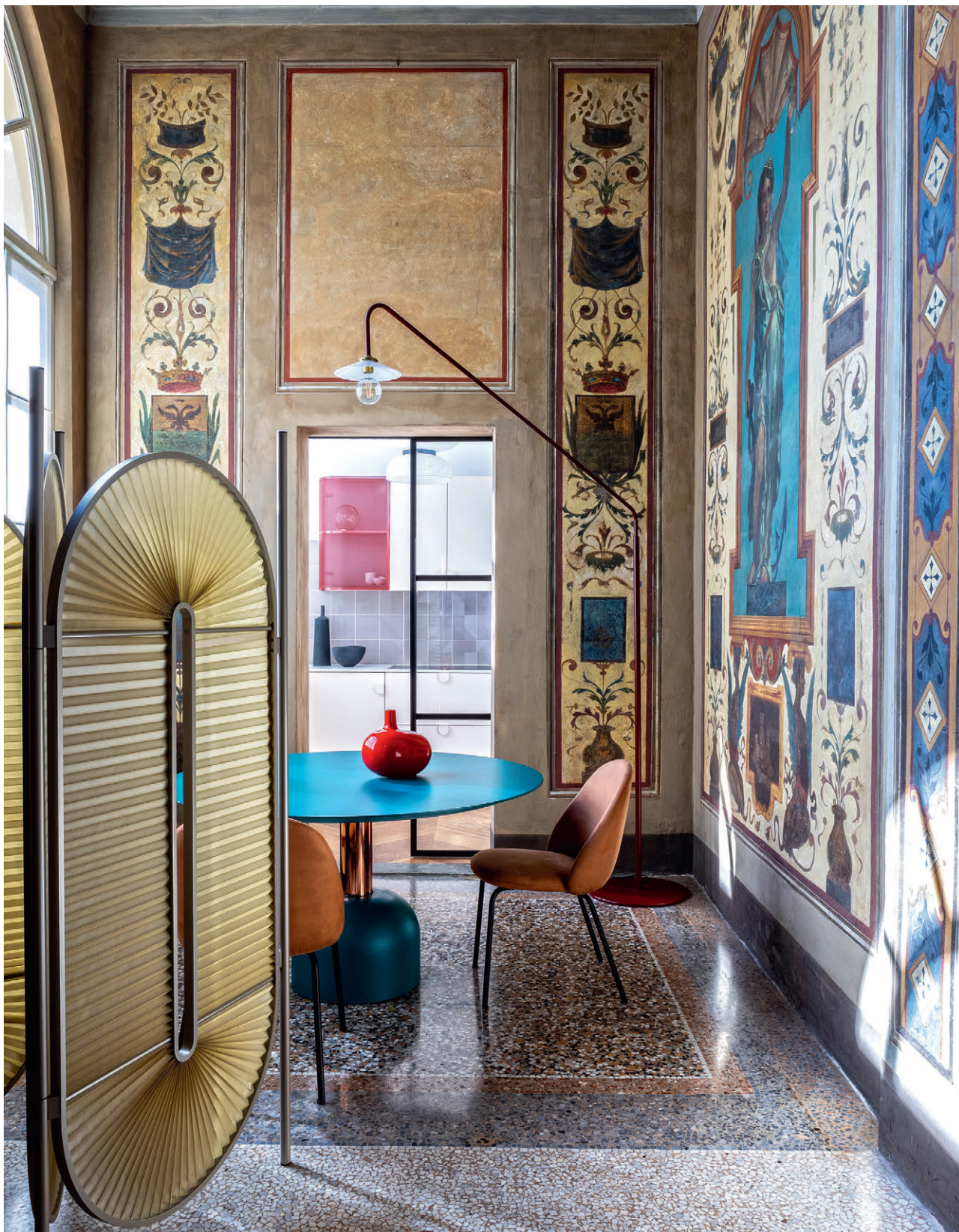
KĄCIK ŚNIADANIOWY ukryty za parawanem Minima Moralia z plisowanej tkaniny (proj. Christophe de la Fontaine). Nad okrągłym stołem Illo i krzesłami lola (wszystko od Miniforms) unosi się lampa z galerii Valerie Objects'. Minimalistyczne meble kolorystyką i formą idealnie współgrają z bogatą dekoracją ścian. W tle, za szklanymi drzwiami widać fragment kuchni.